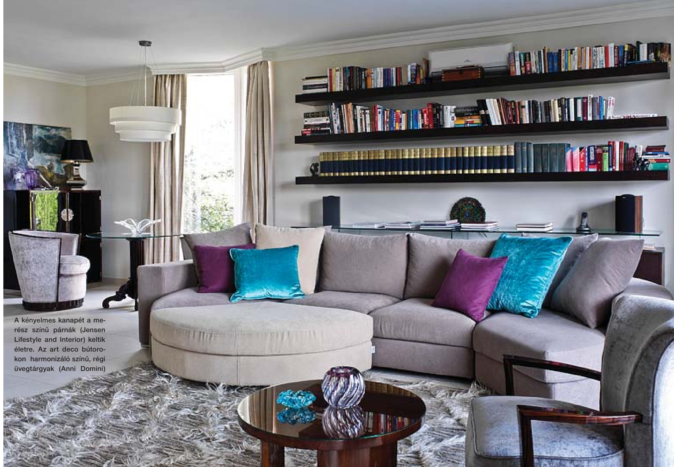
A kényelmes kanapét a mérsékelt színű párnák (Jensen Lifestyle and Interior) keltik életre. Az art deco bútorokon harmonizáló színű, régi üvegtárgyak (Anni Domini)