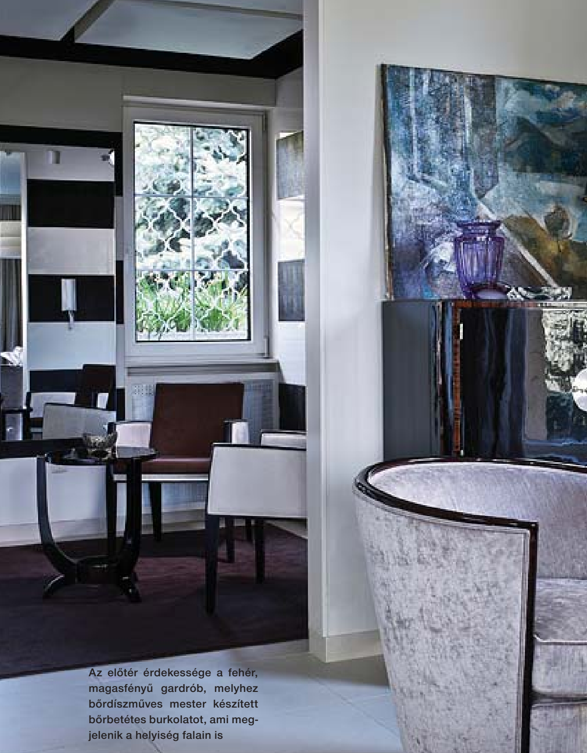
Az előtér érdekessége a fehér, magastényű gardrób, melyhez bőrdíszműves mester készített bőrbetétes burkolatot, ami megjelenik a helyiség falain is