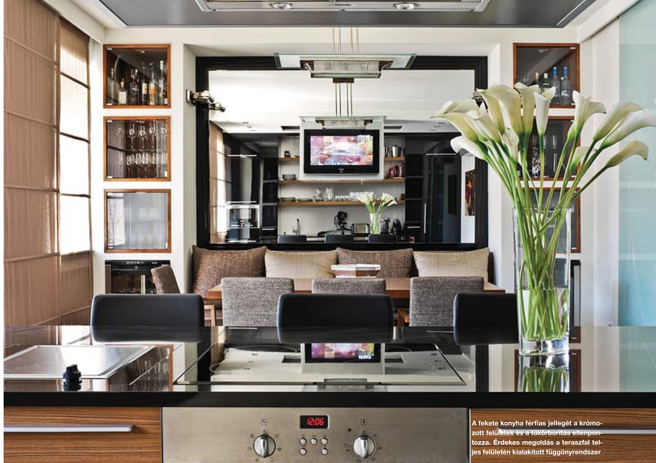
A fekete konyha férfias jellegét a króm-zott felületek és a tükörborítás ellenpontoszza. Érdekes megoldás a teraszfal teljes felületén kialakított függönyrendszer