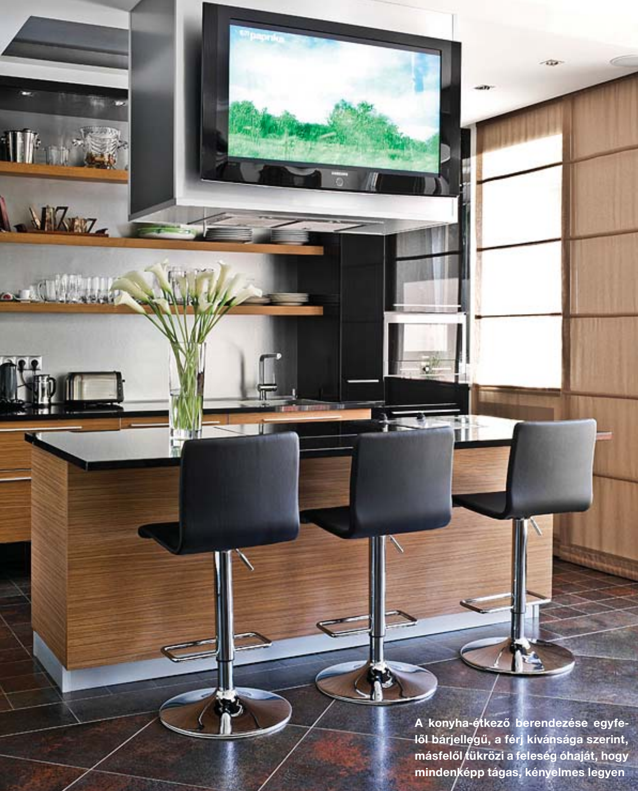
A konyha-étkező berendezése egyfelől bárjellegű, a férj kívánsága szerint, másfelől tükrözi a feleség óhaját, hogy mindenképp tágas, kényelmes legyen