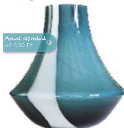
Anni Domini, 30 000 Ft