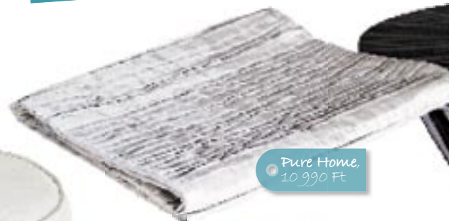
Pure Home, 10 990 Ft