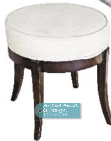
ArtCore Antik és Design, 110 000 Ft