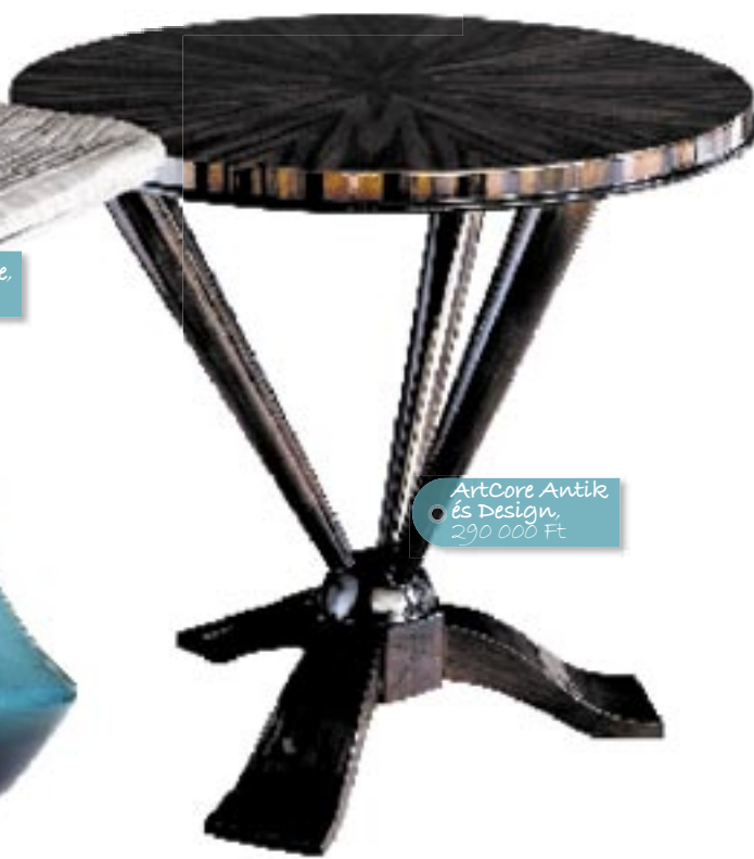
ArtCore Antik és Design, 290 000 Ft

Styling: Torma Beatrix Részletes üzletlista a 97. oldalon